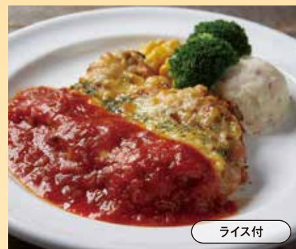
チキンミラネーズ Chicken Milanese